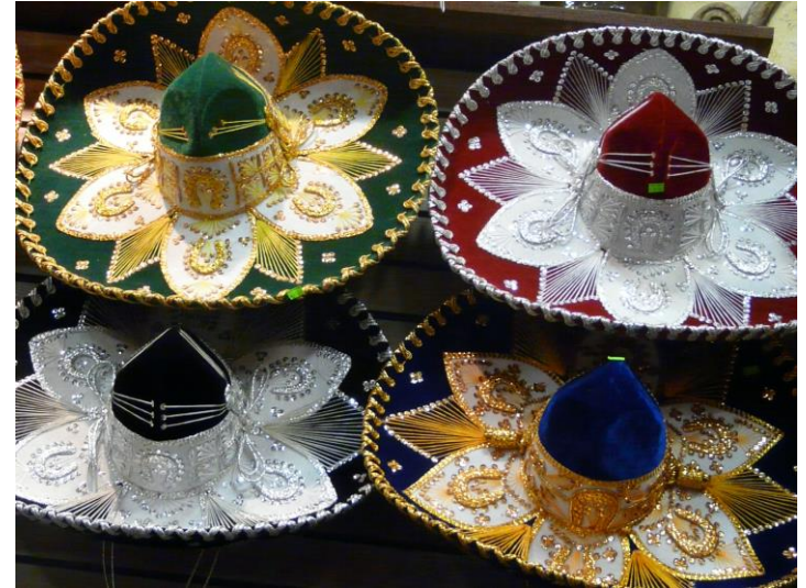
San Diego 2012