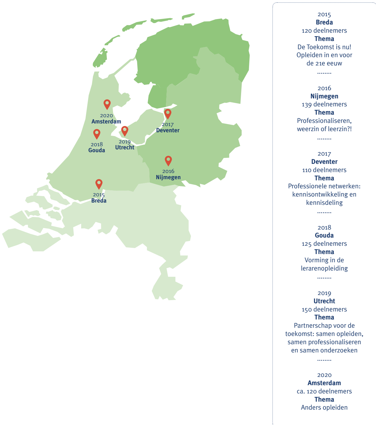
Figuur 1 Overzicht locaties, aantal deelnemers en thema's Velon Studiedag 2015 – 2020

nog niet (overal en altijd) tot stand (Deenen, Khaled, & Geldens, 2015). Ook in andere landen leunt professionalisering van lerarenopleiders vaak nog op individuele initiatieven (McPhail et al., 2019; Cools, Placklé, & Meeus, 2016). De vraag is waarom structurele professionalisering van lerarenopleiders moeizaam tot stand komt. Een mogelijke verklaring is dat lerarenopleidingen deel uitmaken van instituten voor hoger onderwijs die eerst en vooral gericht zijn op het professionaliseren van ál hun docenten en die ‘docenten van (aankomende) docenten’ daar automatisch deel van laten zijn, zonder hen als beroepsgroep apart aan te spreken op hun professionaliseringsbehoeften.